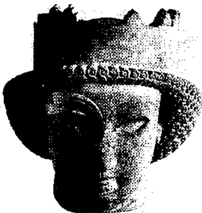
تصویر ۱۷۲. سری از خمیر شیشه‌ی آبی، تخت جمشید

همین آرایش مو را در سری می بینیم که از تخت جمشید به دست آمده است. این سر به تقلید از سنگ لاجورد، لعابی به رنگ آبی دارد (تصویر ۱۷۲). چشم‌ها و ابروان از لعاب شیشه‌ای و به رنگی دیگر ساخته شده است. این سر می‌توانست از آن یک زن باشد. همچنین سری از سنگ آهک که در مسجد سلیمان پیدا شده، یا سر دیگری از گل پخته از شوش ممکن است زنانه باشد. (۴۲).