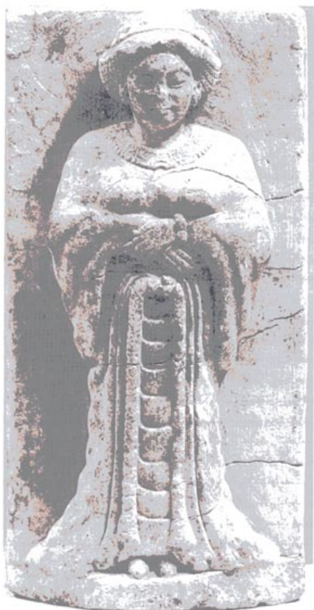
تصویر ۱۷۱. نگاره‌ای از سنگ آهک از مصر، زنی در جامه‌ی ایرانی

همین آرایش مو را در سری می بینیم که از تخت جمشید به دست آمده است. این سر به تقلید از سنگ لاجورد، لعابی به رنگ آبی دارد (تصویر ۱۷۲). چشم‌ها و ابروان از لعاب شیشه‌ای و به رنگی دیگر ساخته شده است. این سر می‌توانست از آن یک زن باشد. همچنین سری از سنگ آهک که در مسجد سلیمان پیدا شده، یا سر دیگری از گل پخته از شوش ممکن است زنانه باشد. (۴۲).