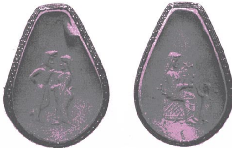
تصویر ۱۷۹ - مهری چهاررویه با تصویر. در یک روی تصویر زن و مردی در لباس ایرانی نقش شده و در روی دیگر زنی نشسته پرنده ای را برای بازی به دخترش می دهد