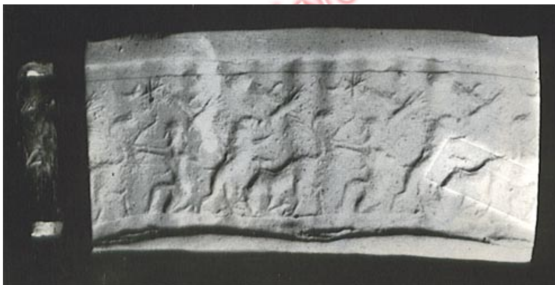
نقش مهر استوانه ای که در روی خمیر مخصوص منعکس گردیده و در آن شکارگاهی نموده شده است: حروف مقطع از نوع میخی علانمی در روی آن دیده میشود.

۱۱- خط پارتی (اشکانی) که با خط پهلوی ساسانی اختلاف داشته است.