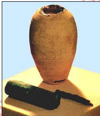
باتری پارتی با پیشینه‌ی ۲ هزار ساله

از آغاز قرن بیستم، باستان‌شناسان زیادی جاهای باستانی میان رودان را در پی سندهایی برای داستان‌های کتاب مقدس، مانند درخت دانش و طوفان نوح، کندوکاو کرده بودند. اما کونیگ زمان خود را برای پیدا کردن این گونه چیزها صرف نمی‌کرد. او بر این باور بود که یک باتری باستانی را پیدا کرده و باید برای شناساندن آن به جهانیان و اثبات ادعای خود کوشش کند. به راستی، کوزه‌ی سفالی که استوانه‌ی آن از مس درون آن جای دارد درب آن با آسفالت (قیر و شن) بسته شده و به درب نیز میله‌ی آهنی متصل است. چه شباهتی به پیل ولتا دارد!!