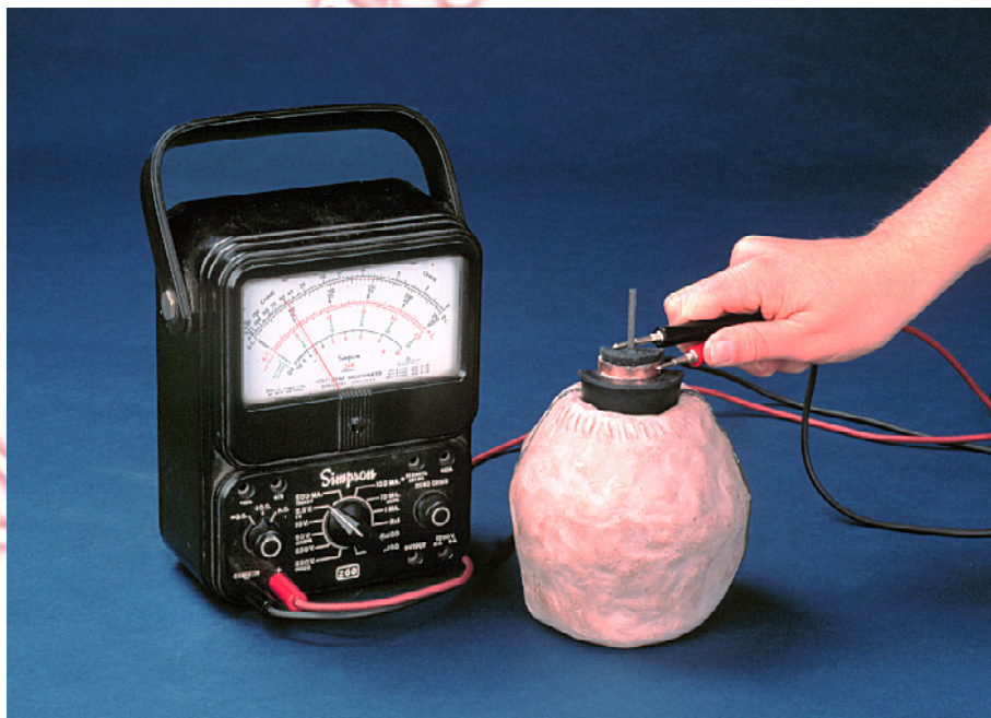
نمونه بازسازی شده باتری پارتی

جنگ جهانی دوم از ادامه ی پژوهش ها روی باتری های ایرانی جلوگیری کرد، مام پس از آن که ویران سازی فروکش کرد و آبادانی بار دیگر رونق گرفت، ویلارد گری (Willard F. M. Gray) از آزمایشگاه ولتاژ بالای شرکت جنرال الکتریک در ماساچوست، چند نمونه از این باتری ها ساخت. زمانی که آنها را با الکترولیتی مانند شیره ی انگور (سرکه) پر کرد، آن دستگاه ها حدود ۲ ولت برق تولید کردند. این آزمایش بر شگفتی پژوهشگران و باستان شناسان افزود؛ چرا که دستگاهی پس از ۲ هزار سال هنوز کار میکند.